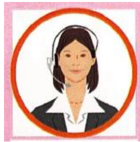
通 訊 業 者

お問合せの内容に応じて、解決に役立つ日本の法制度や 弁護士会などの関係機関を無料で紹介します。