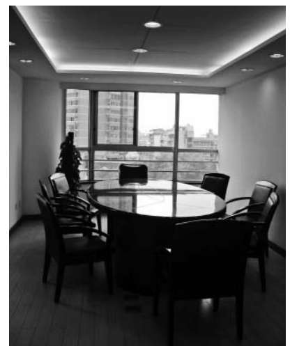
交流拠点内の会議室

武漢市でも、6月になってから、武漢の気温のように、ワールドカップ熱が、日を追うごとに盛り上がってきています。バーやナイトクラブで友達同士お酒を飲みながら一緒に試合観戦するのが流行っています。こんなことから、今、睡眠不足の男性が増えています。