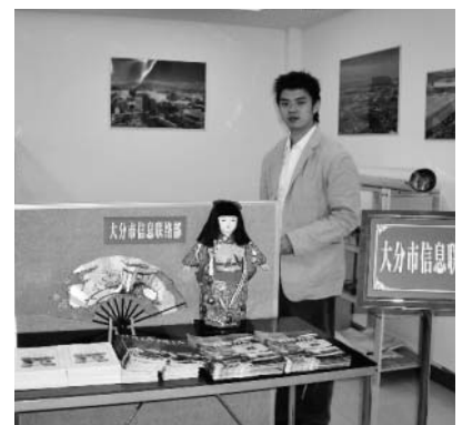
パンフレットなどを展示しているオフィス