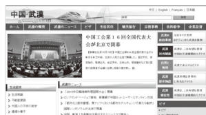
武漢市政府HP日本語サイト

先日、同プロジェクト実施1周年にあたり、外国人文化交流懇親会を開きました。「home in Wuhan」プロジェクト会員部門及び武漢在住の外国人、武漢市民に呼びかけをして、国内外交流の土台を作り、「home in Wuhan」プロジェクトの実施成果を展示すると同時に、武漢在住の外国人の実際の感想、意見を広い範囲で聞き取り、「home in Wuhan」プロジェクトの事業を更に促進し、外国人の生活、仕事の環境をより改善することに力を入れています。