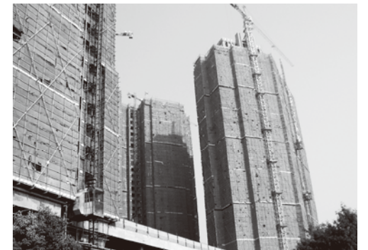
建設中の高層ビル群