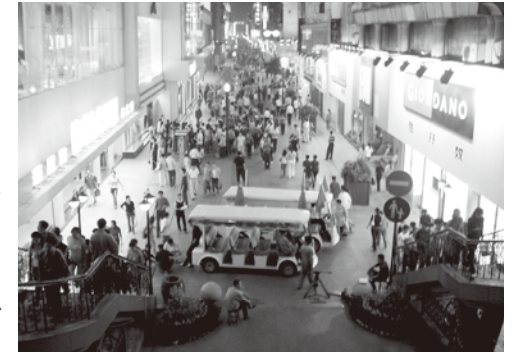
夜まで賑わう武漢の繁華街

中部地方の飛躍は、これまでにない多くの内需を喚起すると多くのエコノミストが指摘しています。時あたかも第17回中国共産党全国代表大会が開催されました。大会では「人本位の和諧社会」(調和ある社会)という言葉が多く使われました。字の如く「和」は「禾」(穀物)を人々が「口」にできることを意味しており、同時に「諧」は「皆」が「言」を発することのできる状態を表現している言葉です。国内で表舞台に立った武漢市と中部地方は、まさに「和諧社会」の実現に向けて、大きく飛躍するために、屈した膝を開放しようとしています。